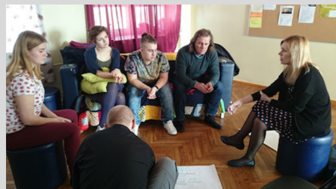
Pildil mõttetalgud Kiviõli 1. Keskkoolis, et kaardistada kohaliku kogukonna väljakutsed, võimalused ja unistused