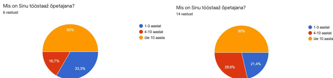
Joonis 1. Sügis 2021 (vasakul) ja kevad 2022 (paremal) õpetajate tööstaaž.

Tööstaaž on pooltel nii sügisel kui talvel registreerunud õpetajatel üle 10 aasta. Ülejäänud 50% hulgas oli sügisel 1-3 aastase staažiga osalejaid rohkem, kevadel aga 4-10 aastase staažiga rohkem (Joonis 1).