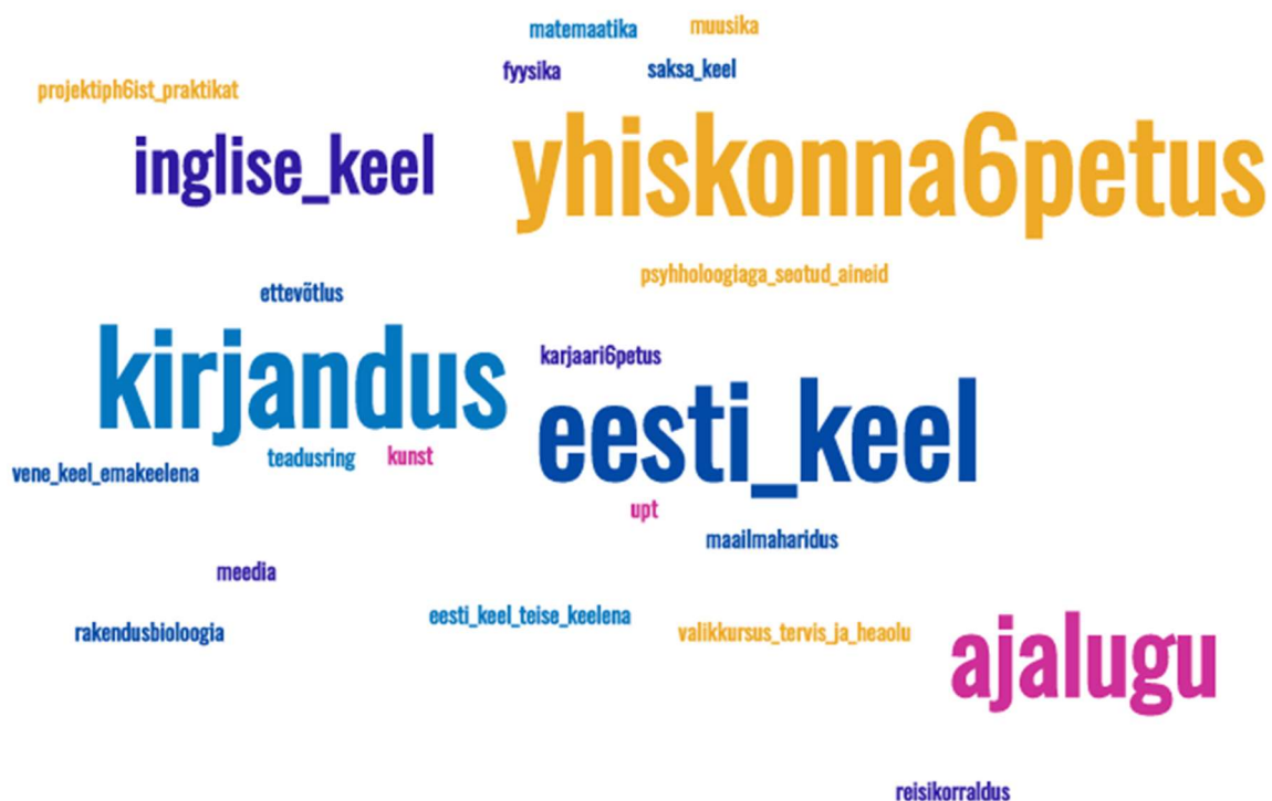
Joonis 3. Aineid, mida osalenud (kooli)õpetajad annavad. NB! Siit on puudu huvijuhid, noorsootöötajad!

Ainete poolest olid esindatud populaarsemalt keeled, sh kirjandus, ajalugu ja ühiskonnaõpetus (vt. joonis 3).