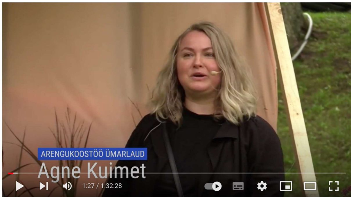
Pilt 4. Salvestus Arvamusfestivalil toimunud arutelust Youtube'is.